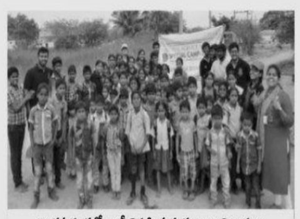
అంతప్పగూడలో ర్యాబీ నిర్వహిస్తున్న కణశాల విద్యార్థులు