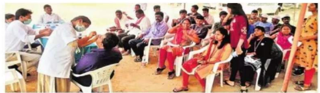
రెడ్డిపల్లిలో దంత పలీక్షలు చేస్తున్న డాక్టర్లు

మొయినాబాద్: గ్రామీణ ప్రాంతాల్లో ఉచిత వైద్య శిబిరాలు నిరాహించడం అబినందనీయమని