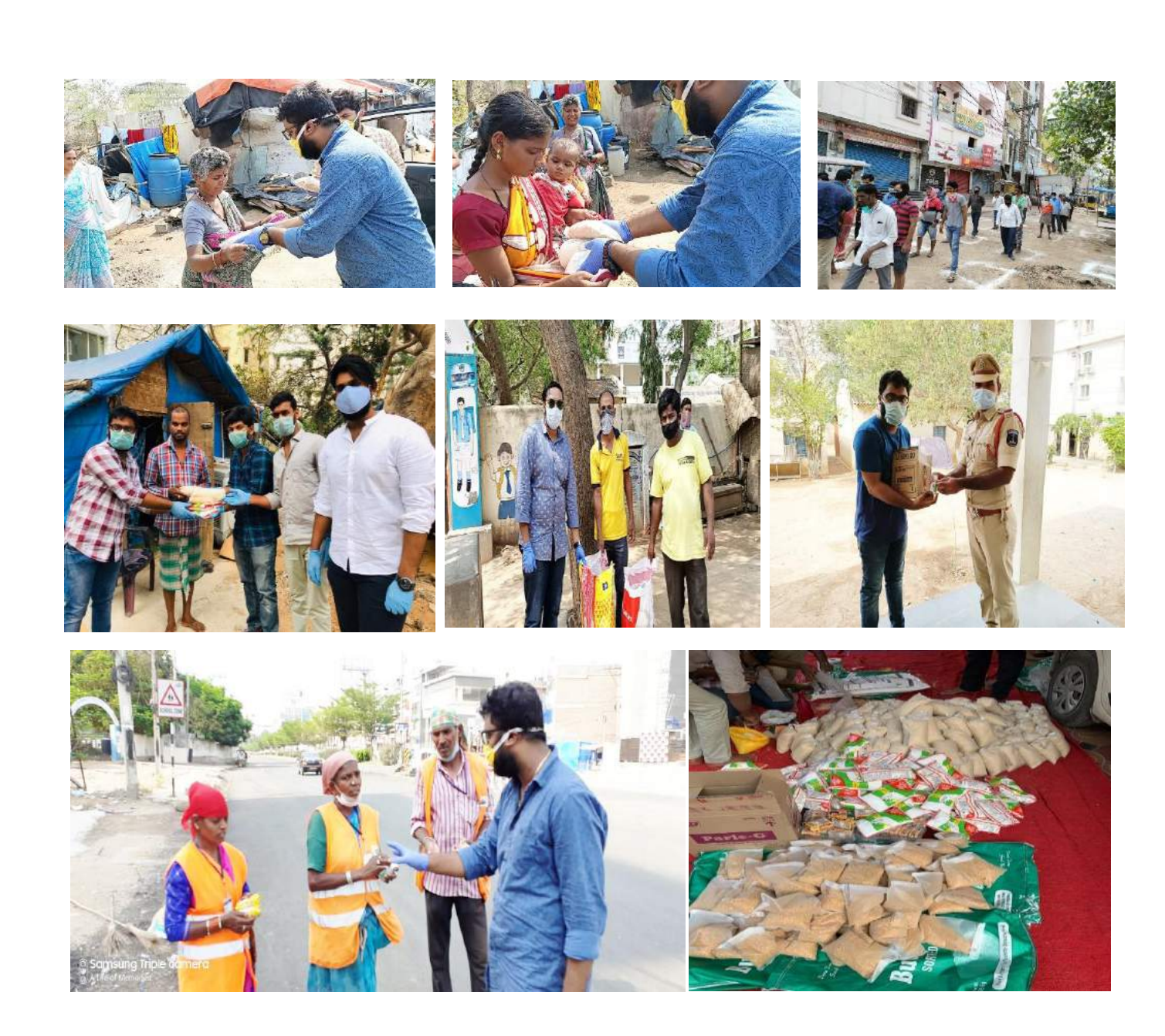
Distribution of groceries & hand sanitizers to the sanitation workers and police by NSS volunteers